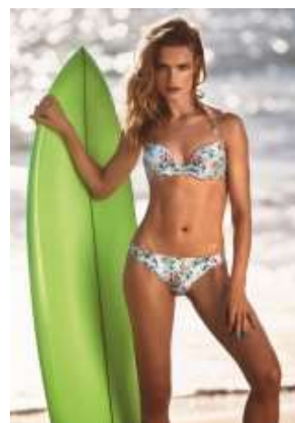
Collection été 2015 - ETAM

Entre le chlore de la piscine, le sel de mer, les surfaces rugueuses aux abords des terrasses ou encore le sable, les maillots de bain sont souvent mis à rude épreuve. Pour cette raison, des adhérents du COFREET, Banana Moon , ETAM et Les Ultraviolettes , spécialistes du maillot de bain vous livrent leurs conseils précieux pour un entretien parfait tout au long de l'été.